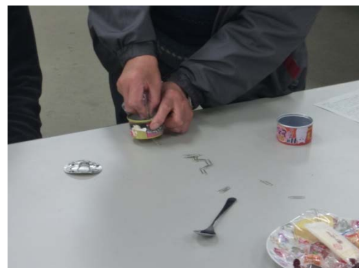
図 4 ネオジウム磁石の磁力実験