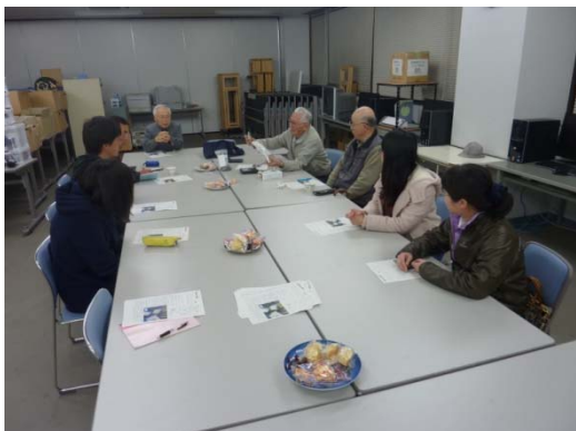
図 1 会議の様子