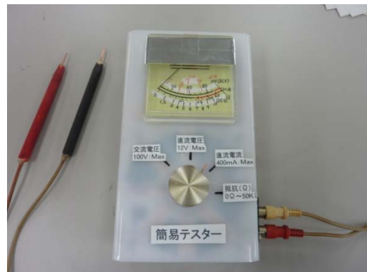
図 2 開発した簡易テスター