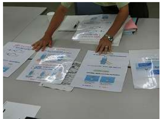
図2 浮沈子資料について