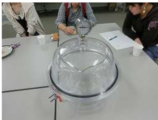
図3 真空装置を使って