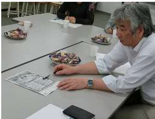
図1 岩国科学教室について